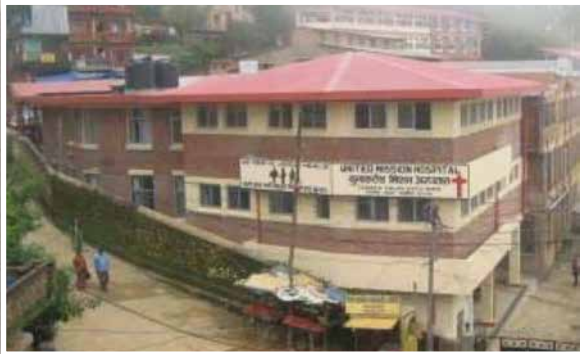
Hôpital United Mission à Tansen, notre partenaire sur place